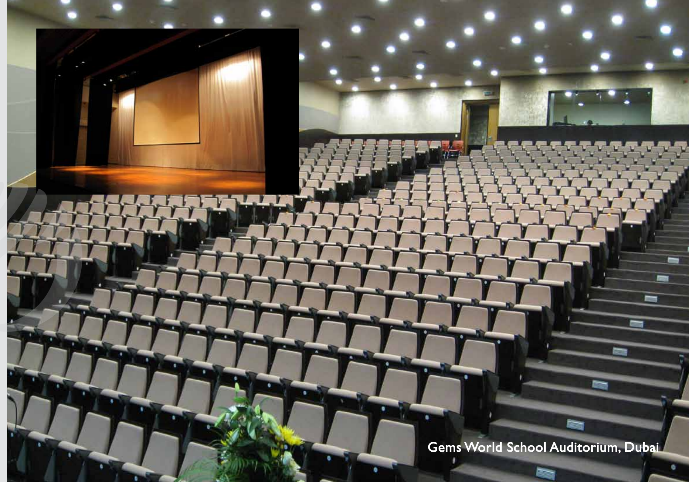
Gems World School Auditorium, Dubai

إن العرض المميز لا يحى من أذهان المشاهدين لفترات طويلة. ولتحقيق ذلك وشد انتباه الحضور فلا بد من توفر أجهزة سمعية ومرئية متطورة، وأن يتم تشغيلها ببراعة. وتقوم شركتنا بتحقيق ذلك من خلال التنسيق الدقيق لأجهزة ومصادر العرض السمعي والمرئي، والشاشات ومكبرات الصوت والسماعات وأجهزة تحويل وتوزيع الإشارة والميكروفونات وأجهزة المزج والكاميرات ووسائل التسجيل السمعي والمرئي للصالات متعددة الأغراض وقاعات المؤتمرات وغرف القيادة والتحكم والمراقبة. بالإضافة إلى تطبيقات أخرى متنوعة في المجالات التعليمية والعسكرية والطبية والفنية وغيرها.