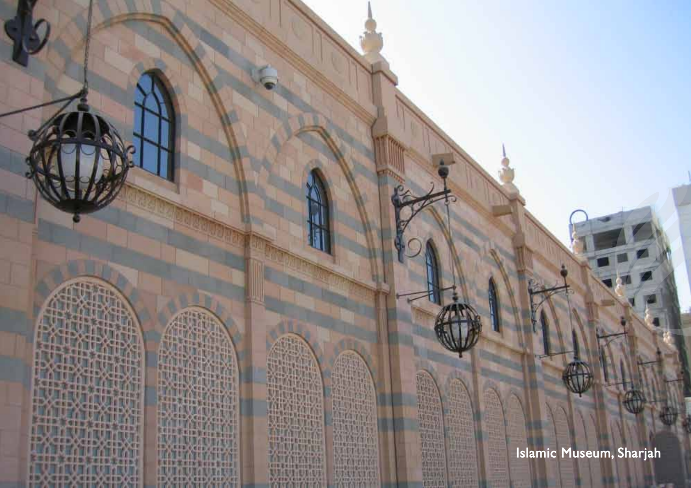
Islamic Museum, Sharjah