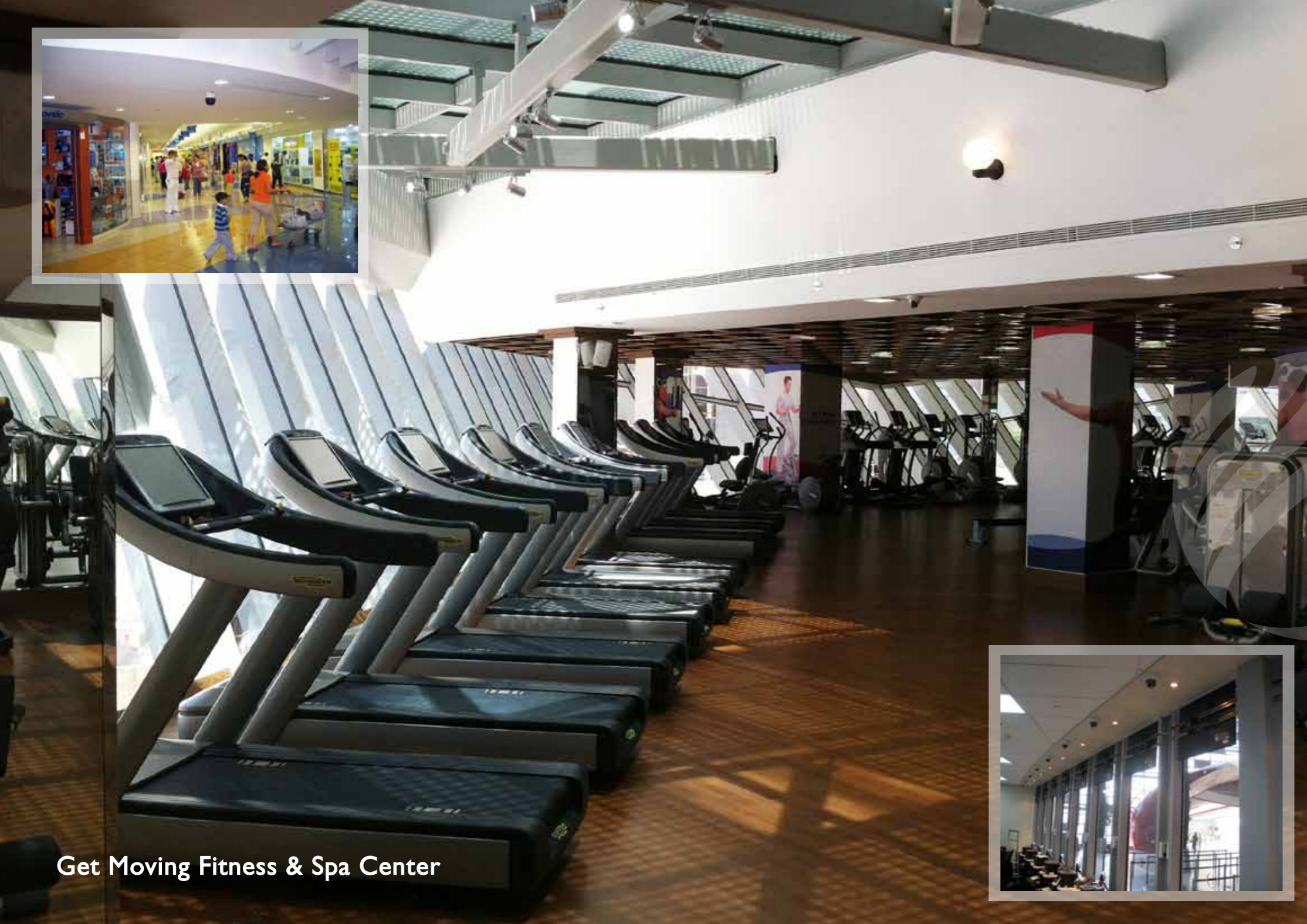
Get Moving Fitness & Spa Center