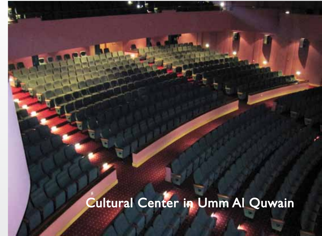
Cultural Center in Umm Al Quwain