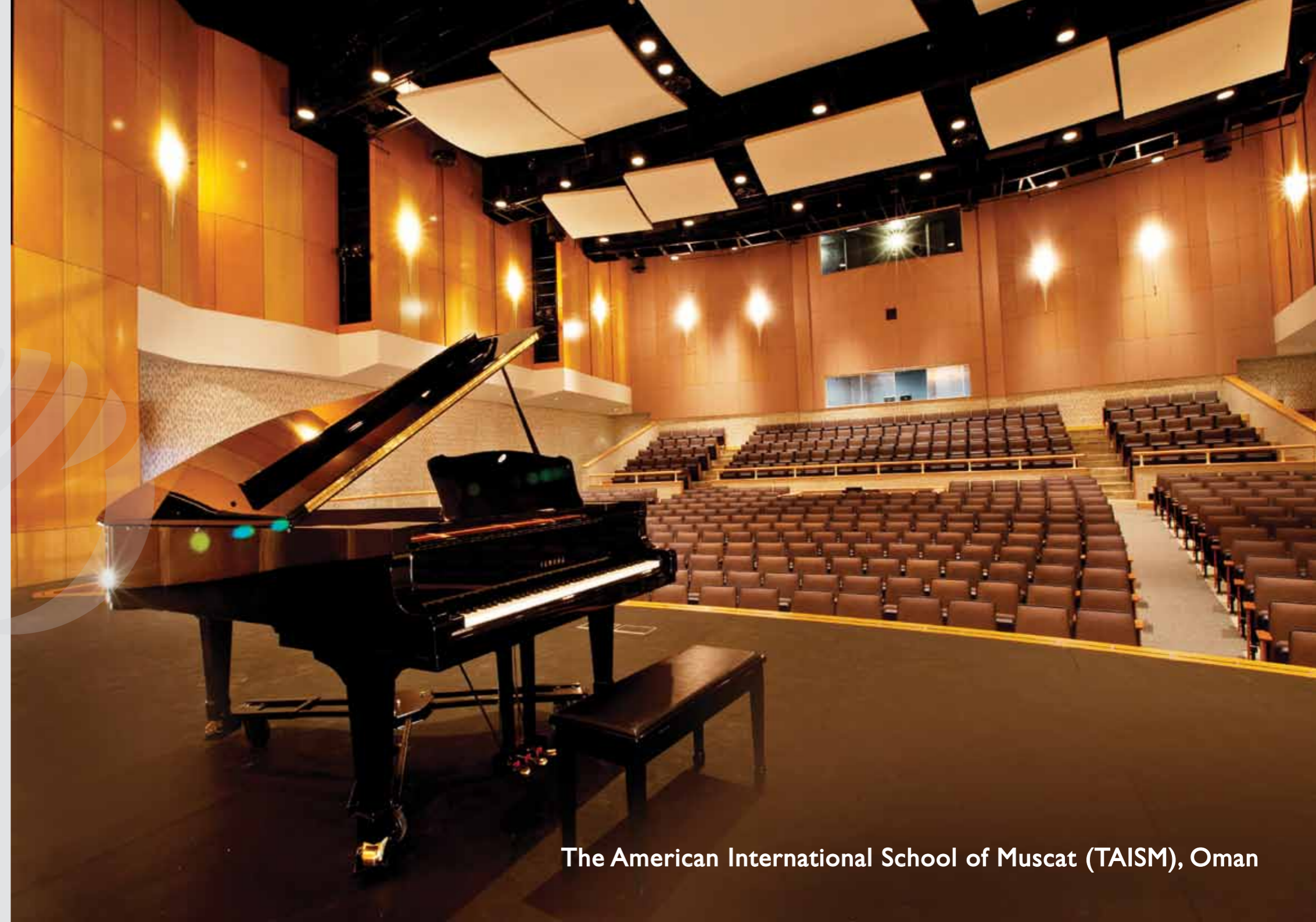
The American International School of Muscat (TAISM), Oman