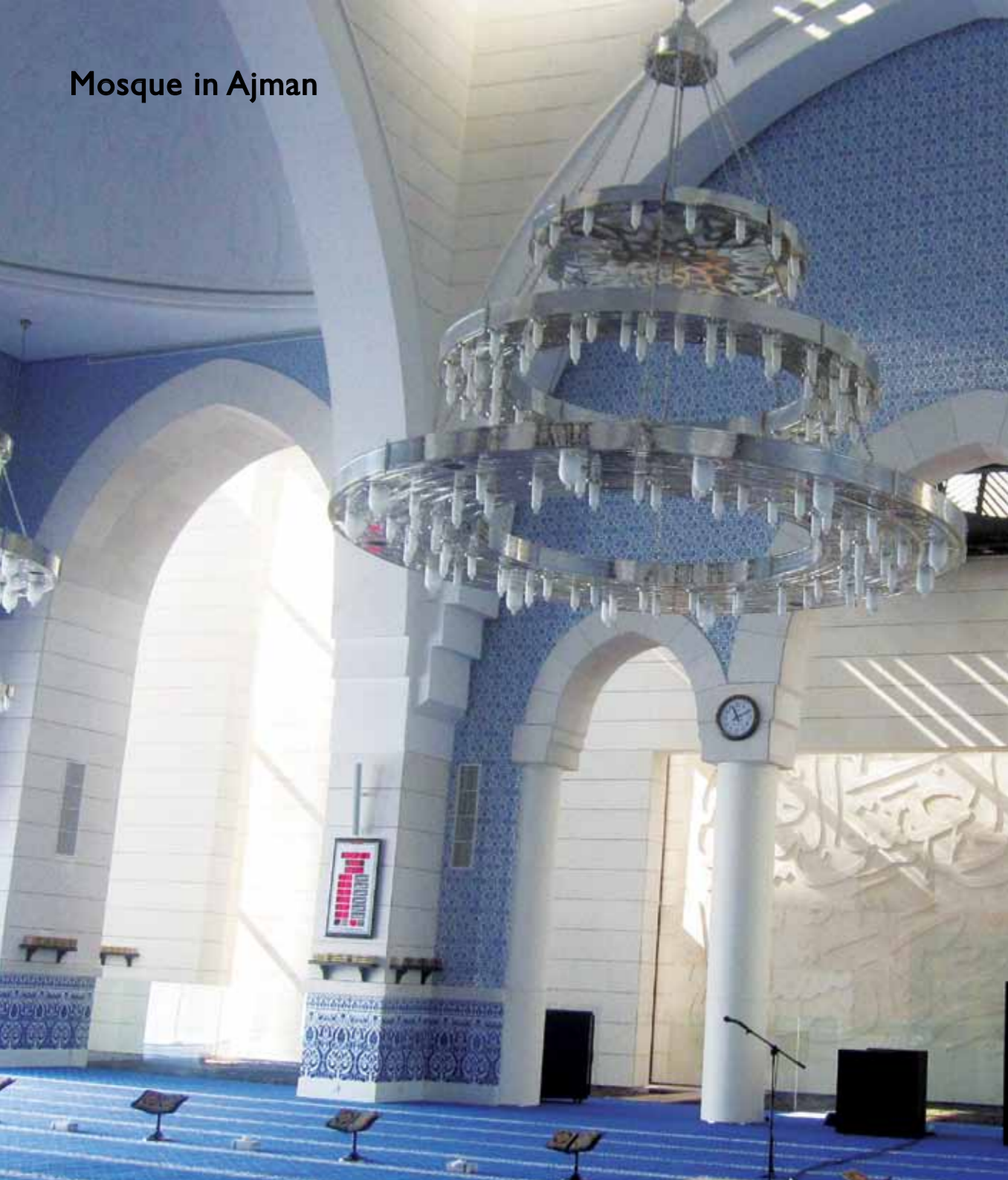
Mosque in Ajman